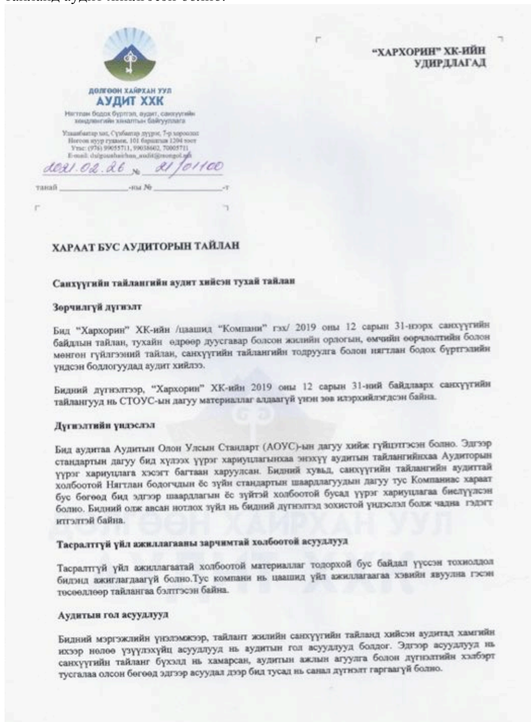
Зураг 1. Хараат бус аудиторын дүгнэлт

Компани нь Санхүүгийн зохицуулах хороонд бүртгэлтэй аудитын компани болох “Дөлгөөн хайрхан уул Аудит” ХХК аудитын компаниар өөрийн 2020 оны жилийн эцсийн санхүүгийн тайланд аудит хийлгэсэн болно.