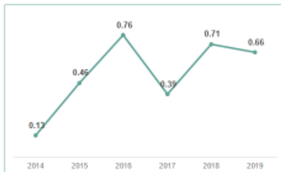
Төлбөр түргэн гүйцэтгэх чадвар