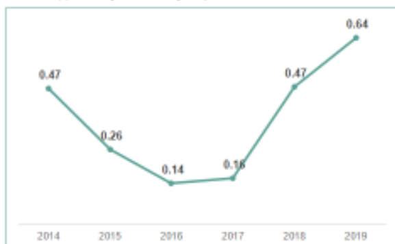
Үндсэн хөрөнгийн эргэц