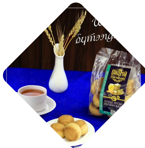
“Онцгой” брэндийн нарийн боов

АРВАЙН ШАНЗТАЙ ЕЭВЭН ШАР ТОСТОЙ ЕЭВЭН АМТАТ ЖИГНЭМЭГ БҮХЭЛ ҮРИЙН ЗӨГИЙН БАЛТ