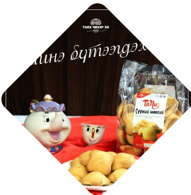
“Та Чи” брэндийн нарийн боов

ЧИАБАТТА КАЙЗЕР РОЛЛ АМЬД ХӨРӨНГИЙН ТАЛХ