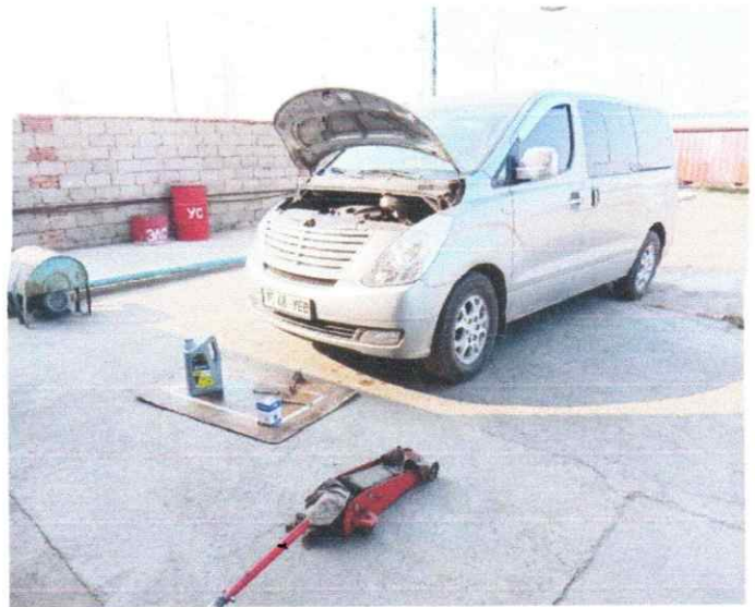
Зураг 7. Тээврийн хэрэгслийн засвар үйлчилгээ