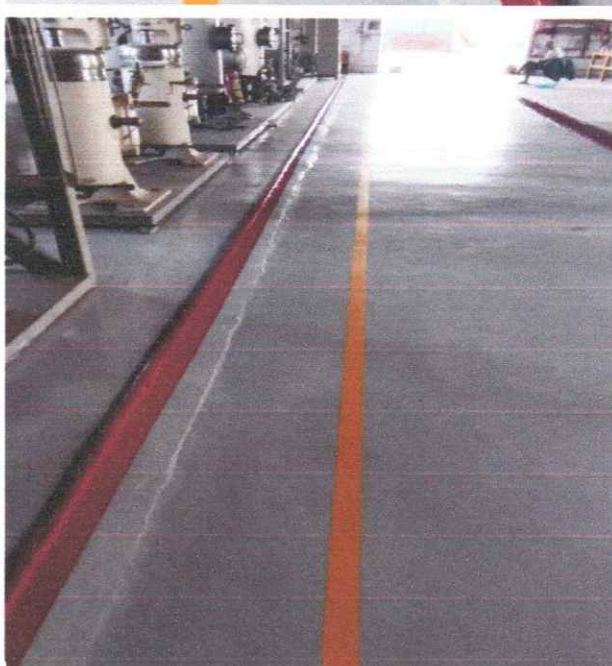
Зураг 10. Үйлдвэр доторх шалны резин будаг