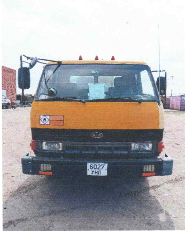
Зураг 6. Тээврийн хэрэгслийн ЕС зөвшөөрөл