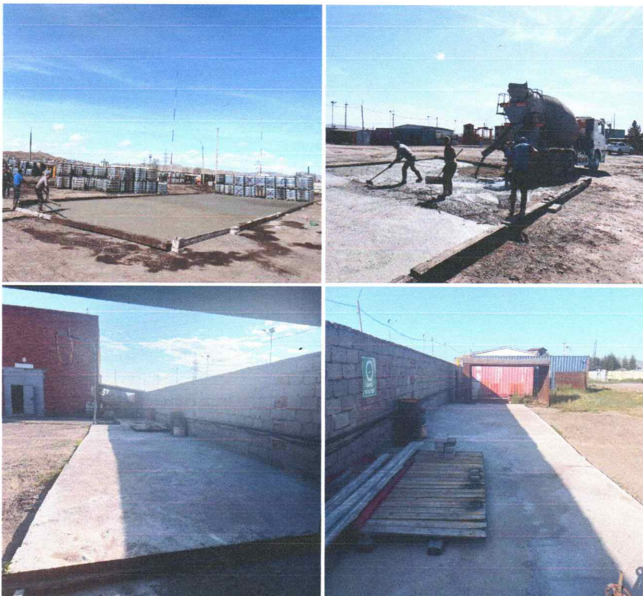
Зураг 9. Хөрс бетонжуулалт